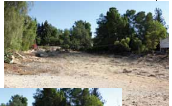
תכנון נחל טביה

רשות ניקוז ים המלח נמצאת בתהליכי אישור סופיים של תכנון מפורט לשיקום נחל טביה ולקראת תחילת ביצוע התכנית. נחל טביה הוא נחל אכזב קניוני עמוק, המתנקז לים המלח. ייחודו של נחל טביה הוא הטבע הנושק לעיר. שיקומו של הנחל יביא למימוש פוטנציאל המשיכה שלו. שיקום נופי של המרחב המדברי באזור נופ זה יתרום לשימור ולפיתוח בר-קיימא של האזור כולו, יהווה משאב תירותי עבור תושבי העיר ואורחיה, ואף חלון ללימודי סביבה, ובית בטוח יותר עבור המערך האקולוגי המתקיים בו.