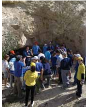
היכרות אתר ארכיאולוגי במסגרת פעילות בנחל בתכנית החינוכית - מאגורה בנחל חסד

תכנית חינוכית סביבתית לנחלי ערד - תכנית קהילתית רב שנתית: תכנית סיורים רב שנתית שהחלה לפעול בנובמבר 2010 וזוכה לשבחים רבים ואף לסיקור תקשורתי נרחב. תכנית זו מתקיימת בשיתוף עם רשות הטבע והגנים, רשות העתיקות ועיריית ערד. התכנית נובעת מראייה מערכתית כוללת של יחסי הגומלין בין האדם והטבע המגוון שסובב אותם, ומיועדת לבתי הספר והקהילה הרחבה בערד, כחלק מפעילות קהילתית המכוונת ליצירת תרבות עירונית מקיימת.