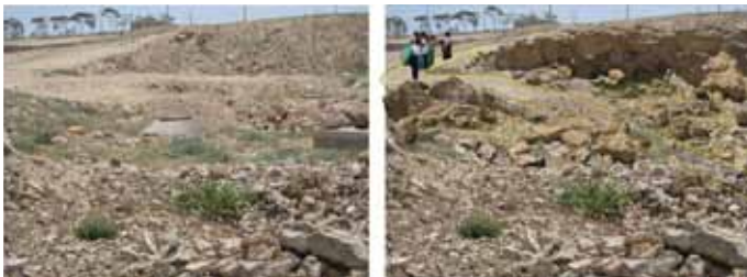
נחל חסד - לפי תכנון רעיוני: שחזור קיר, סימון שבילי טיול ואופניים, ניקיון הנחל והצנעת תשתיות (בור בייוב)

בימים אלו כבר מתקיים בנחל מיזם פעילות חינוכית "אמץ אתר" ארכיאולוגי, במסגרת התכנית החינוכית-סביבתית לנחלי ערד של רשות הניקוז. כל תלמידי ערד מכיתות א' - ט' יוצאים לסיור בנחל חסד, לומדים אודותיו ומבצעים פעילות של חפירות ארכיאולוגיות במאגורה שבנחל.