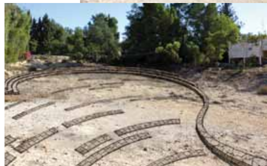
למעלה - לפני התכנון משמאל - אחרי התכנון נקודת התכנסות

עיקרי התכנית לשיקום הנחל כוללים: יצירת מוקדי עניין בנחל כגון שבילים ונגישות לטיול לתושבי העיר ואורחיה, מוקדי עצירה ומנוחה, מוקד התכנסות ללימודי שדה, שילוט להסבר והכוונה. כל אלו יושגו על ידי מתחם מבואת נחל, לימנים מוצלים אשר יהוו מוקד לפיקניק, אזור התכנסות לקבוצות וכיתות לימוד, ייצוב הקרקע למניעת נזקי שטפונות בנחל והחלפת תחנת שאיבה ישנה שמי בייוב גולשים ממנה אל תוך הערוץ.