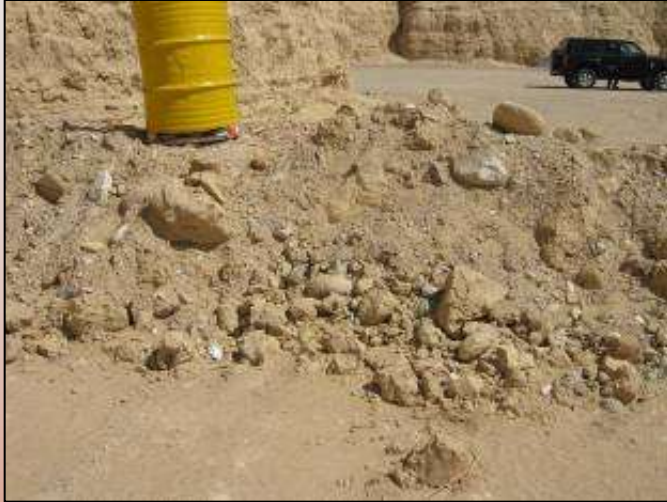
ערמות עפר בכניסה לנחל