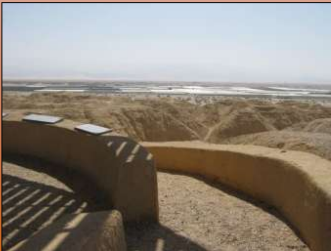
סכנת זיהום מחקלאות בסמוך לנחל