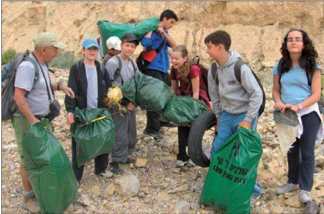
איור 2 – פעילות אקטיבית לדוגמא- ניתן לראות מבצע ניקיון נחל יעלים ביוזמת רשות ניקוז ים המלח ויחידה סביבתית נגב מזרחי. הניקיון בוצע ע"י תלמידי כיתה ז' "אורט- ערד" לרגל יום כדה"א- בתאריך ה- 22/04/2010 ( http://dadeadsea.co.il/LinkClick.aspx?fileticket=ux88R8FTsVY%3d&tabid=719 )